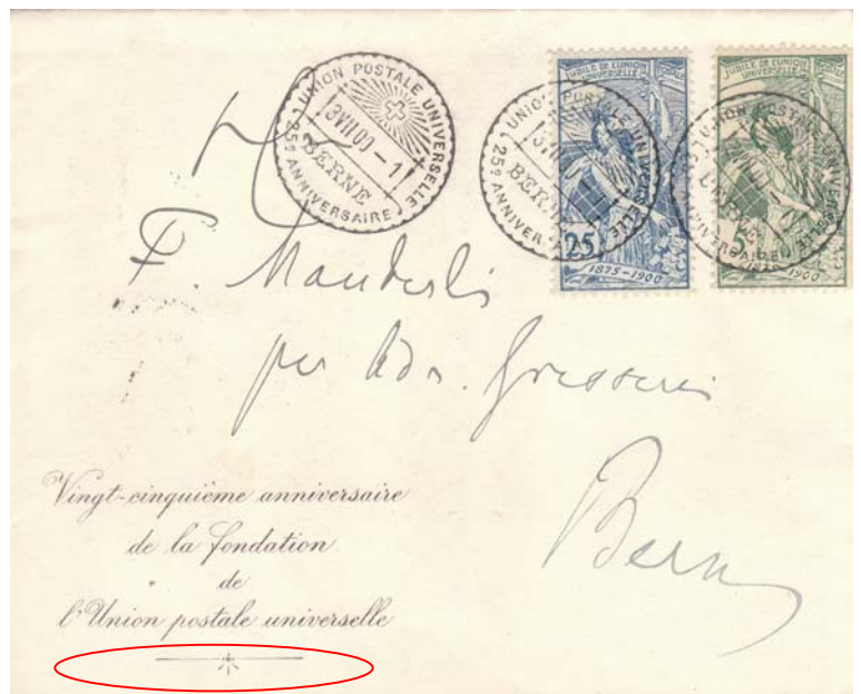
Kuvert Grösse: 14,1 x 11,6 cm Glattes Papier