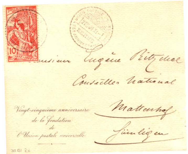
Kuvert Grösse: 12,9 x 10,6 cm Leicht flockiges / Leinenmuster ( geriffelt ) Papier